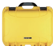
増設用 1KWh CGE-O-BTP1-1.0K